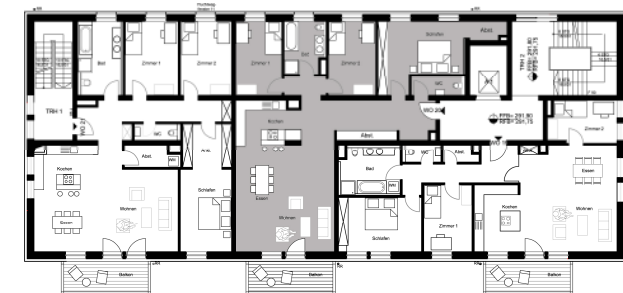
Wohnen im Magnoliengarten Veielhaus / Grundriss 1. Obergeschoss